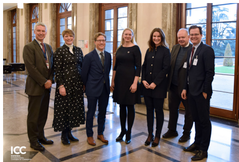
Bild från ICC:s paneldiskussion om cirkulär ekonomi i Genève 2019

För ICC:s arbetsgrupp blir nästa steg att fortsätta diskussionerna med UD och Kommerskollegium om hur man kan analysera alla typer av handelshinder relaterade till cirkulär ekonomi.